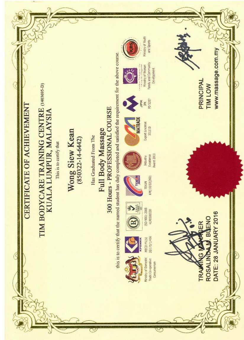
Contoh sijil kursus kami